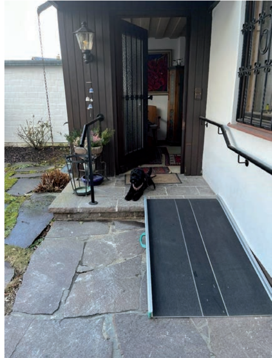
Mobile Rampe Hauseingang