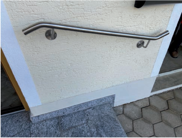
Handlauf, eine Stufe