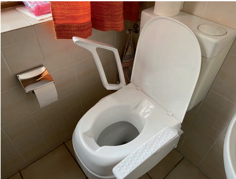
WC-Sitzerhöhung mit Stützgriffen