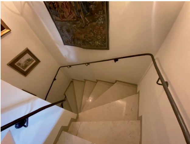
Durchgehender Handlauf Treppe