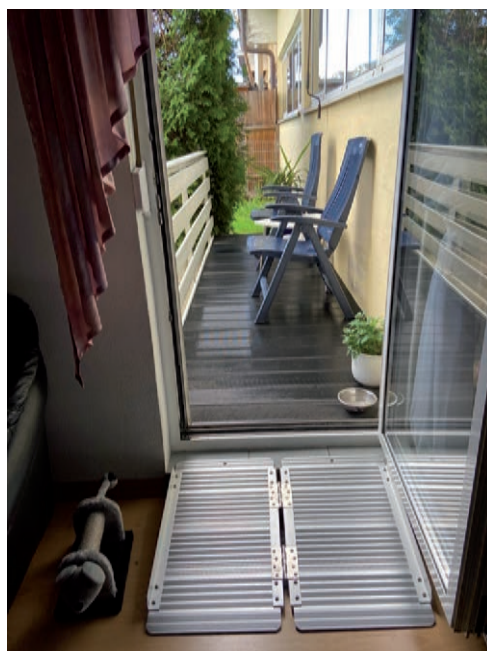
Rampe zur Terrasse