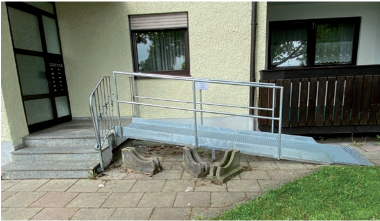
Fest verbaute Rampe